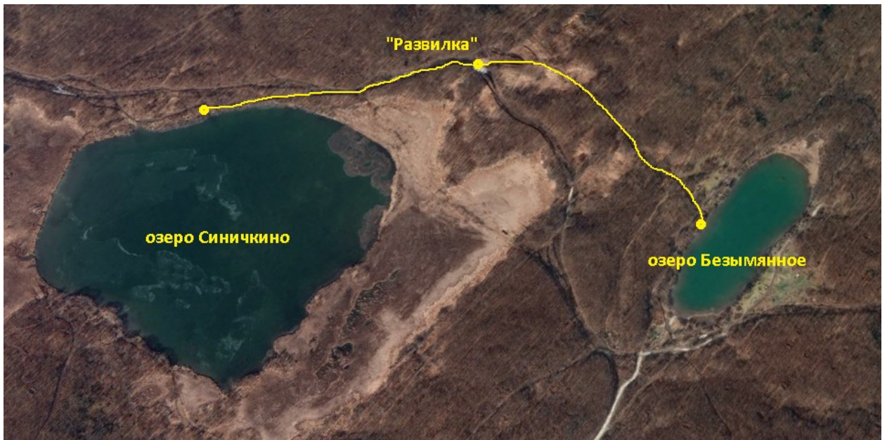
Рис.12 Обзорный вид на пятый участок маршрута