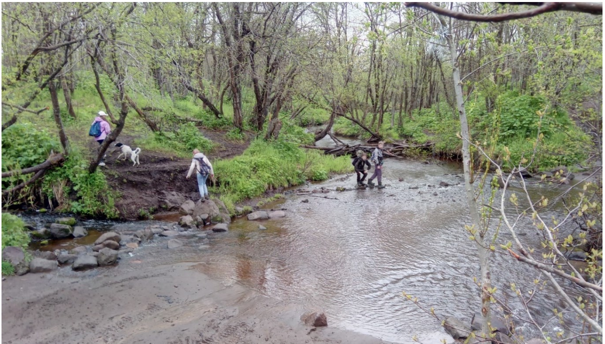
Рис.7 Брод на р. Кирпичная (июнь 2019 г.)