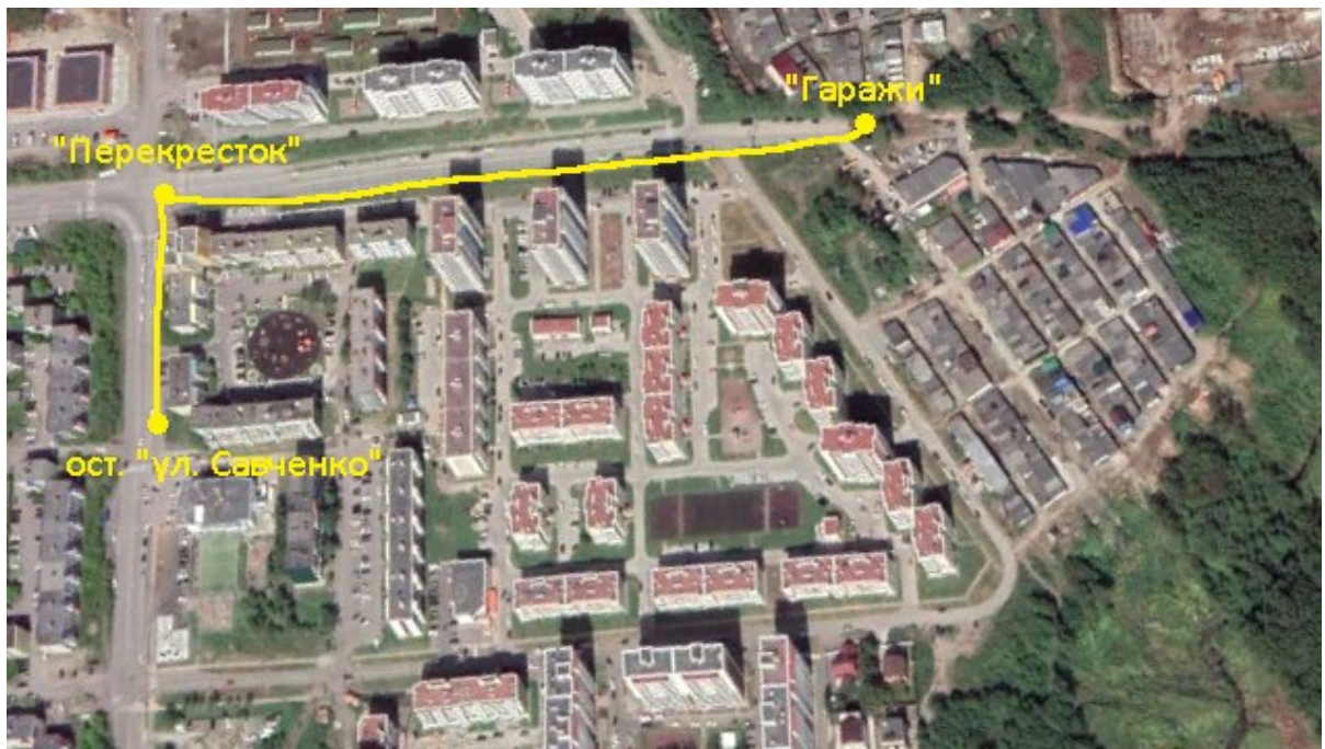
Рис.3 Обзорный вид на первый участок маршрута

Маршрут начинается от остановки «ул. Савченко». Движемся до перекрестка со светофором по тротуару в северном направлении. На перекрестке сворачиваем на право и следуем до капитальных гаражей (см. Рис.4).