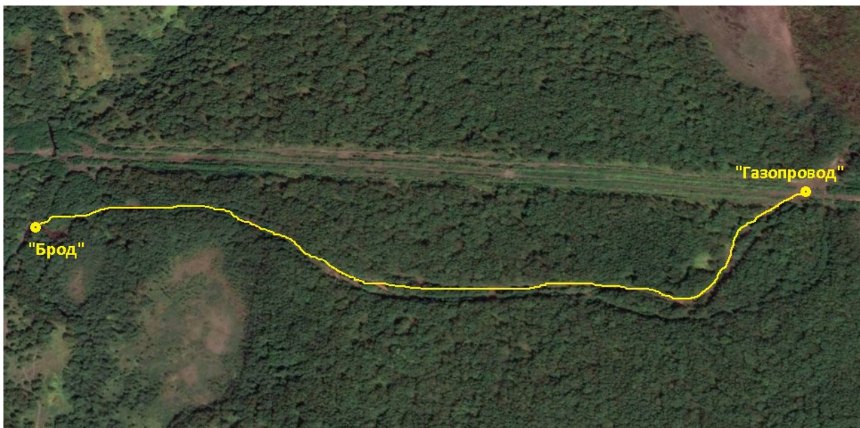
Рис.8 Обзорный вид на третий участок маршрута