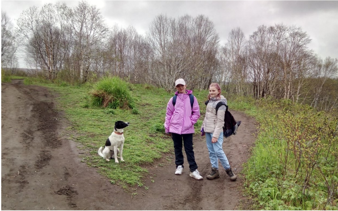
Рис.6 На развилке