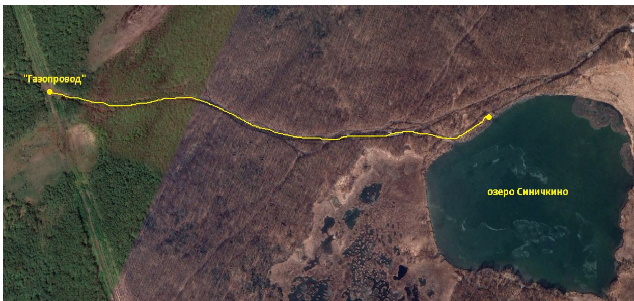
Рис.10 Обзорный вид на четвертый участок маршрута