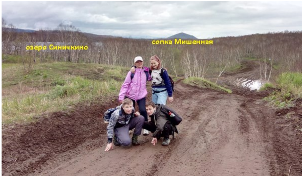
Рис.13 По дороге на озеро Безымянное