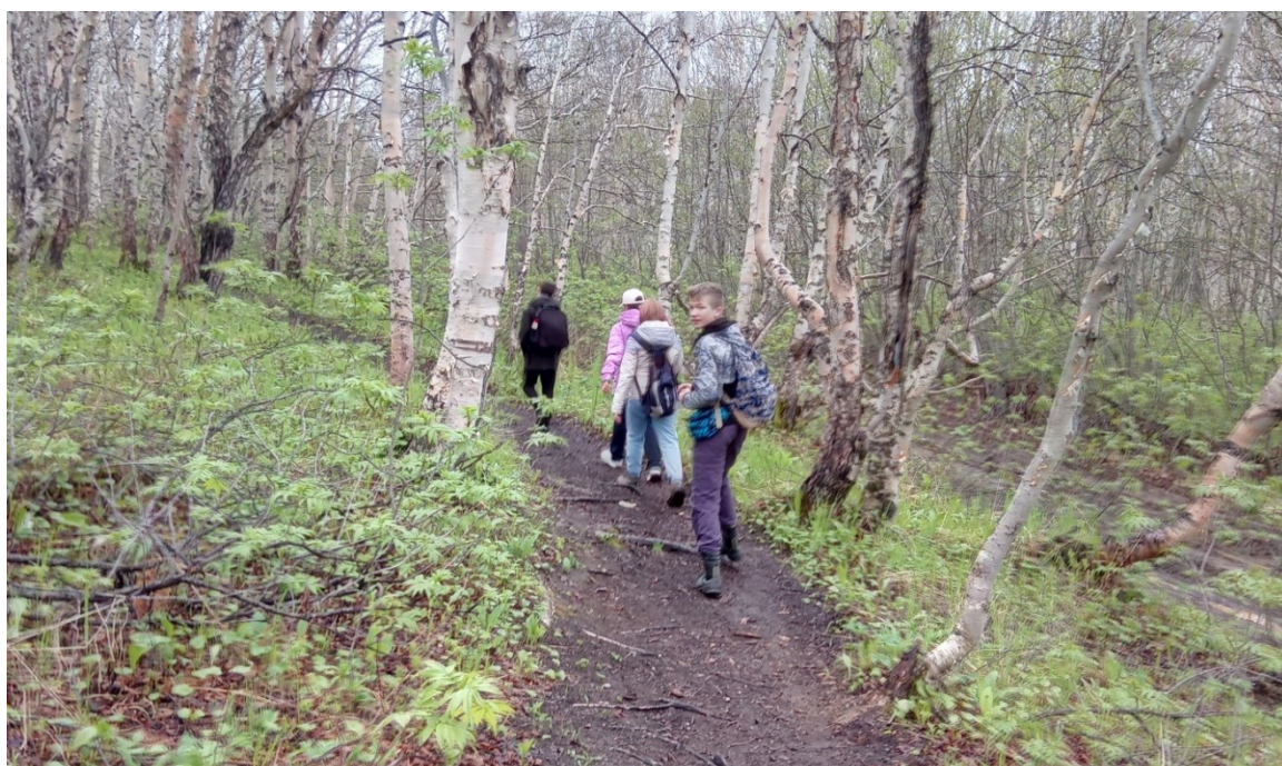
Рис.9 Тропа вдоль грунтовой дороги