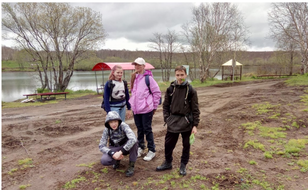
Рис.14 Озеро Безымянное