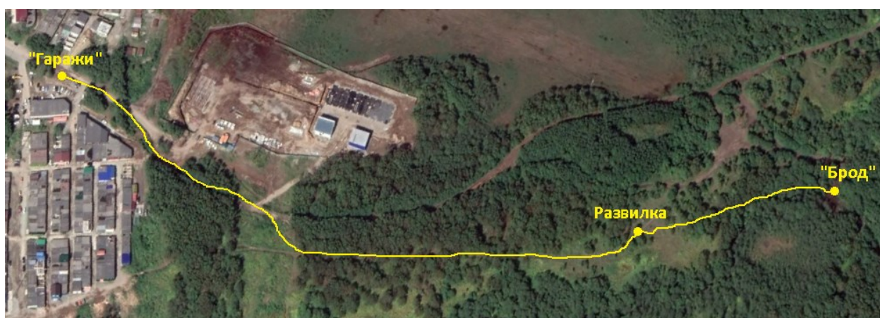
Рис.5 Обзорный вид на второй участок маршрута

Переправу можно осуществить по временному мосту, предварительно проверив мост на прочность, по камням или вброд (см. Рис.7).