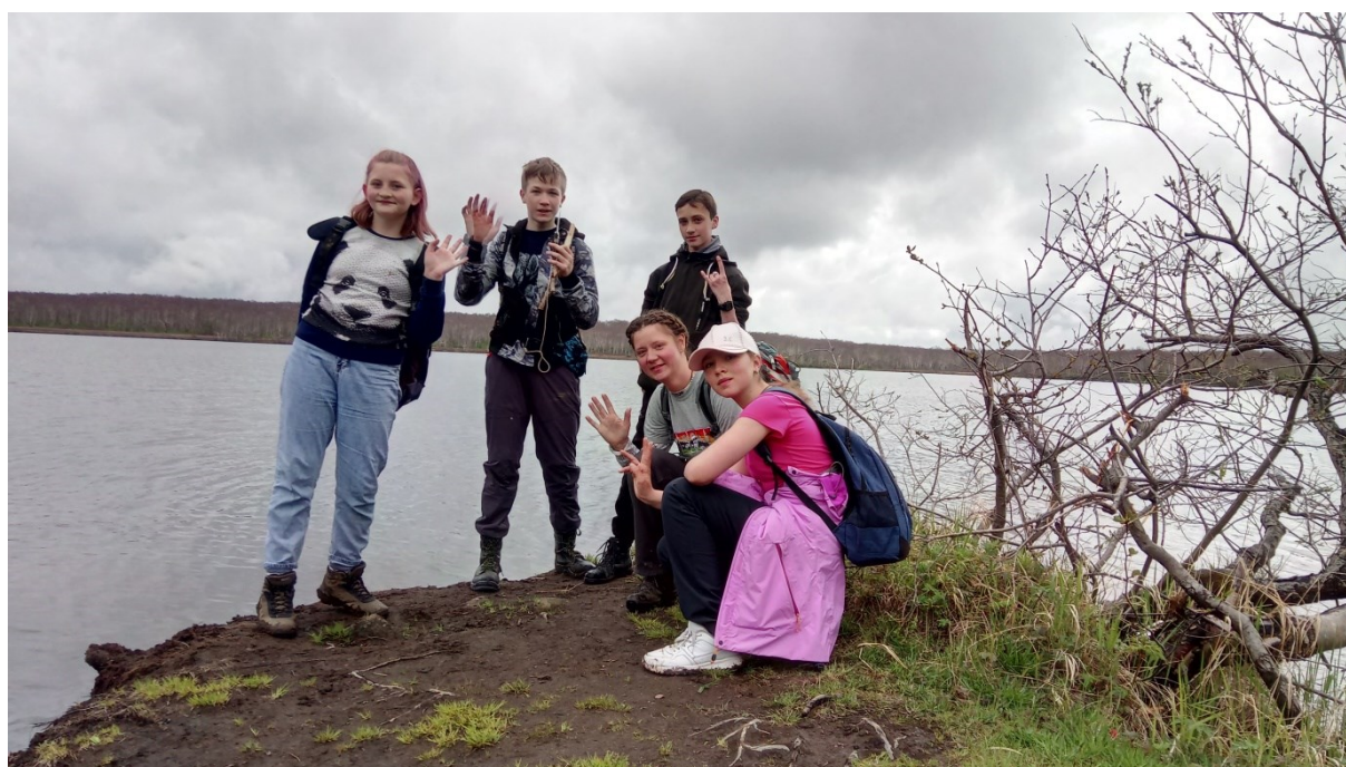
Рис.11 Озеро Синичкино