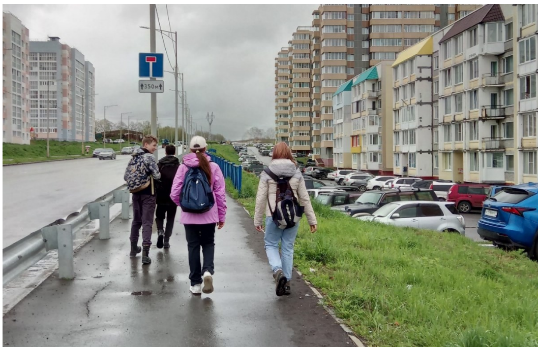
Рис.4 По дороге к капитальным гаражам