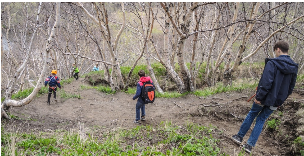
Рис.4 Спускочная тропа

Спускаться следует по тропе, проложенной на юго-западном склоне. Троп на склоне протоптано довольно много, руководителю следует придерживать наиболее безопасных. Перед спуском необходимо напомнить учащимся о соблюдении техники безопасности при спусках.