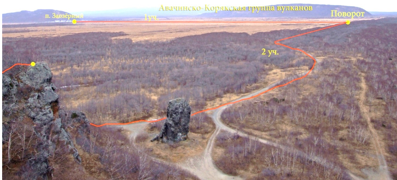
Рис.2 Обзорный вид второго участка маршрута

Далее продолжаем движение по дороге, ведущей в юго-западном направлении. Дорога проложена прямо по границе леса и поля, где-то ныряет больше в лес, но, как правило, по правую руку во время движения мы видим поле, по левую – лес, также на этом участке видно Халактырскую скалу, которую можно использовать как ориентир.