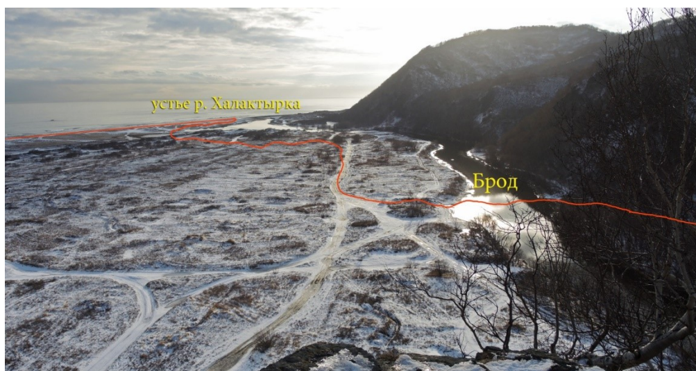
Рис.9 Вид с Халактырской скалы в сторону устья р. Халактырка

Далее по дороге движемся вдоль р. Халактырка в сторону брода, который находится недалеко от Халактырской скалы. Река в этом месте широкая, но не глубокая и спокойная. Однако уровень воды обычно выше весной и при длительных осадках, что следует учесть при планировании похода. Ширина переправы – 40 метров, глубина – 50-80 см. Брод следует переходить в запасной обуви.