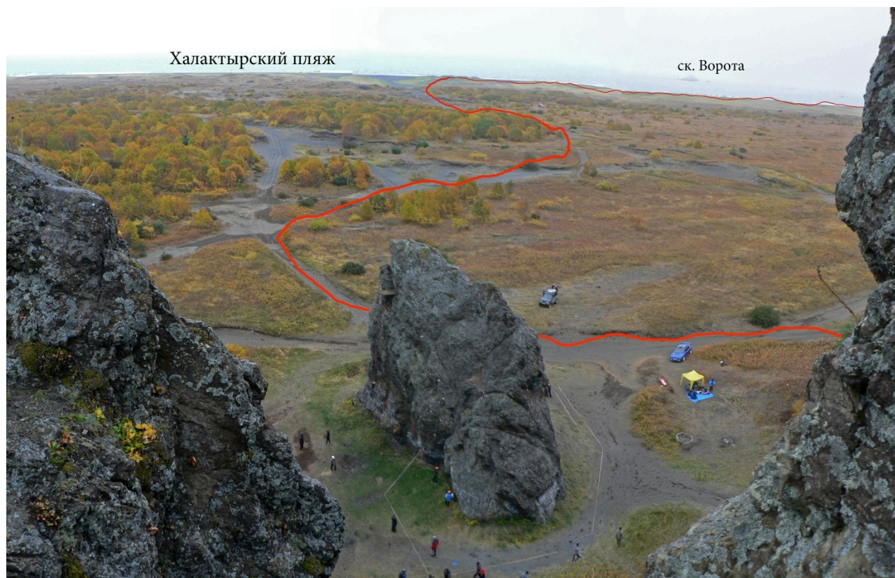
Рис.5 Вид с Халактырской скалы в сторону Халактырского пляжа

Спустившись со скалы, удобно сделать привал и перекусить; даже в ветреную погоду здесь можно найти удачное место, прикрытое от ветра скалами.