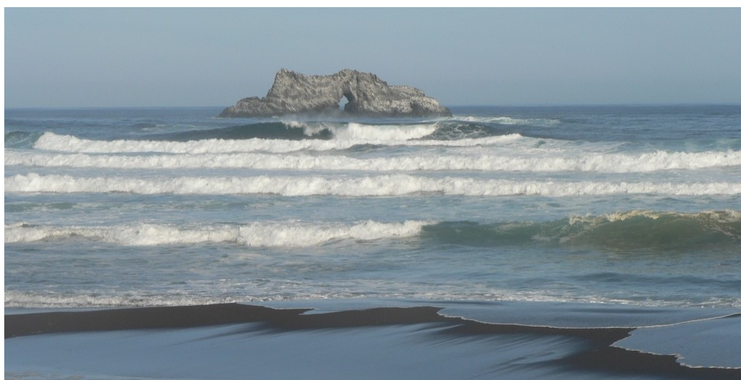
Рис.8 Скала Ворота (Халактырский камень)