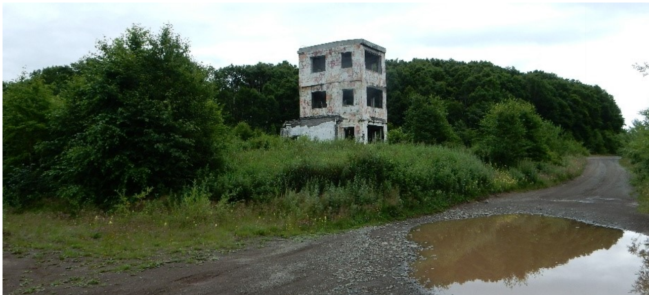
Рис.11 Здание воинской части

Ещё через километр мы увидим руины воинской части, когда-то на этом месте было стрельбище. С этого момента дорога пойдёт немного вверх, огибая небольшую сопку.