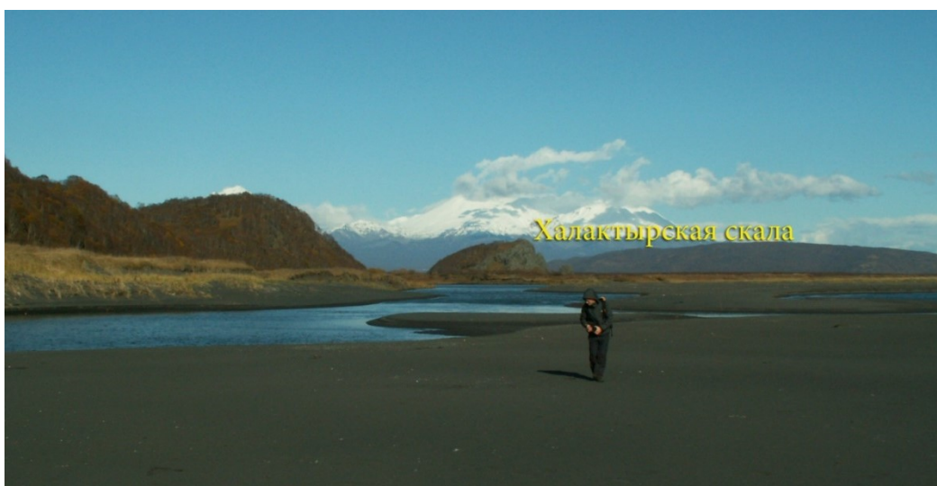
Рис.7 Вид на север от устья р. Халактырка