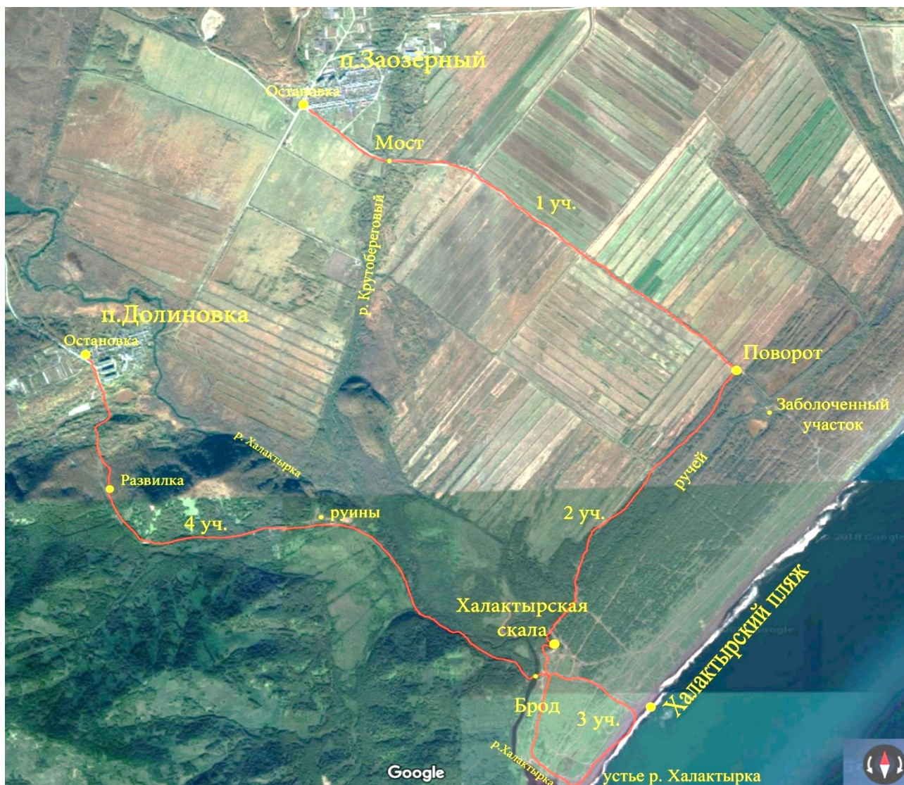
Рис.1 Обзорный вид маршрута

Нитка маршрута начинается с остановки в п. Заозёрный. Самый простой способ узнать, как до нее добраться – пройти по ссылке ( https://2gis.ru/p_kamchatskiy?queryState=zoom%2F11%2FrouteTab ), далее в строку «откуда» ввести адрес ближайшего дома, а в строку «куда» ввести остановка «остановка поселок Заозерный», далее – руководствоваться информацией в появившемся окне.