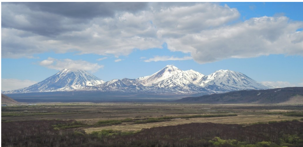
Рис.3 Вид с Халактырской скалы на Авачинско-Корякскую группу вулканов

Подъем на скалу лучше осуществить с северной стороны через лес: тропа проходит вдоль обрыва и выходит на вершину скалы, откуда открываются замечательные виды на окрестности.