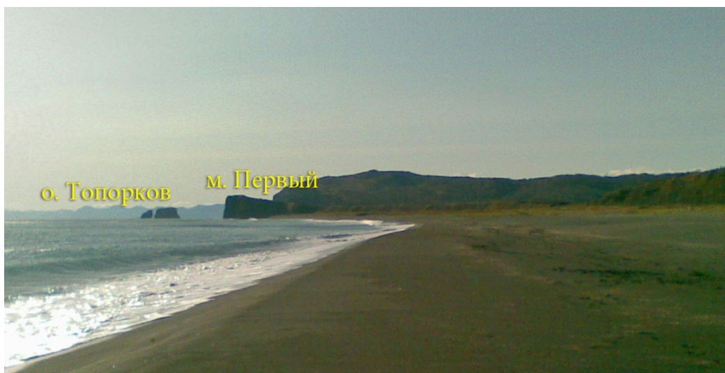
Рис.6 Вид на юг от устья р. Халактырка