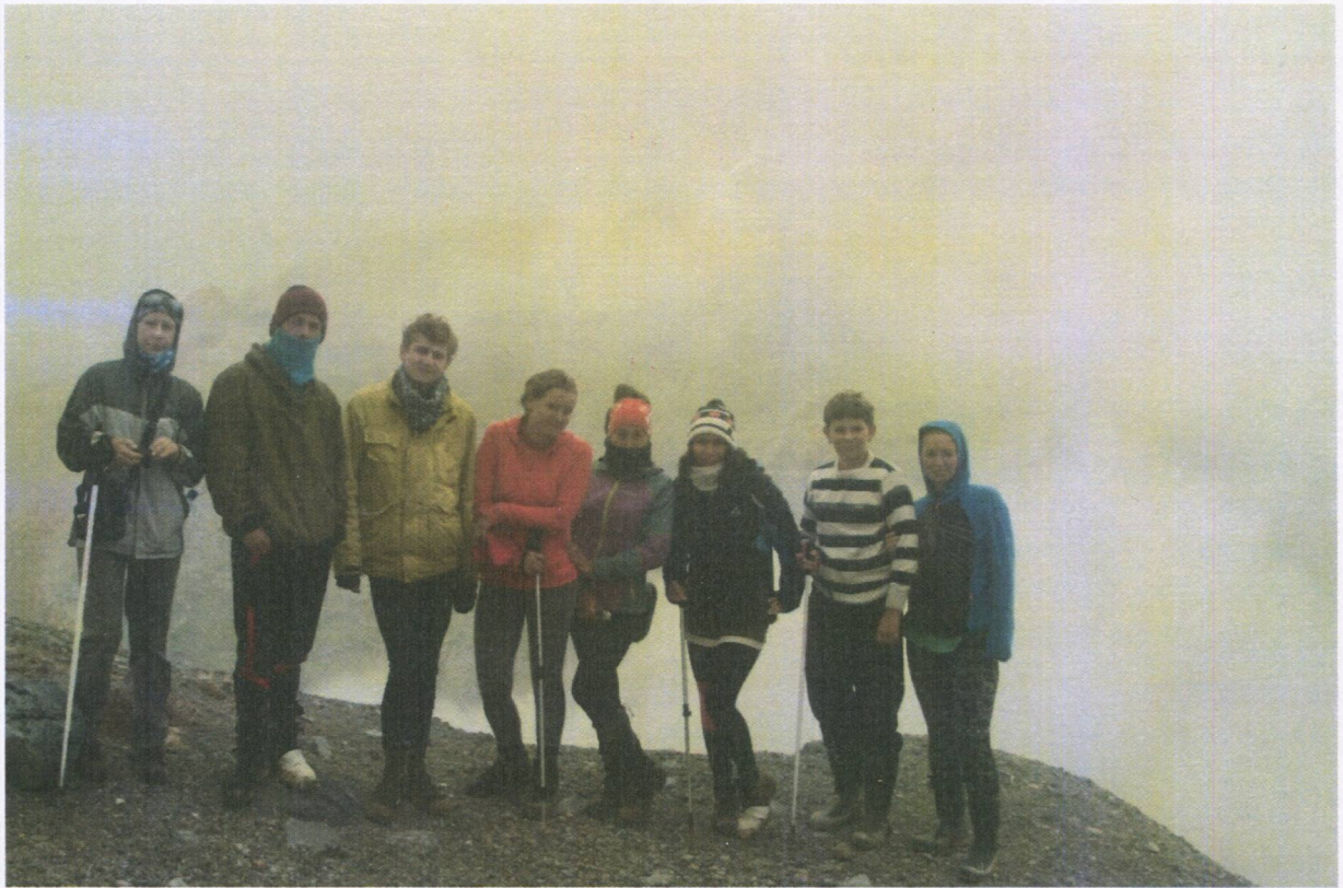
Рис.5 В кратере влк. Мутновского