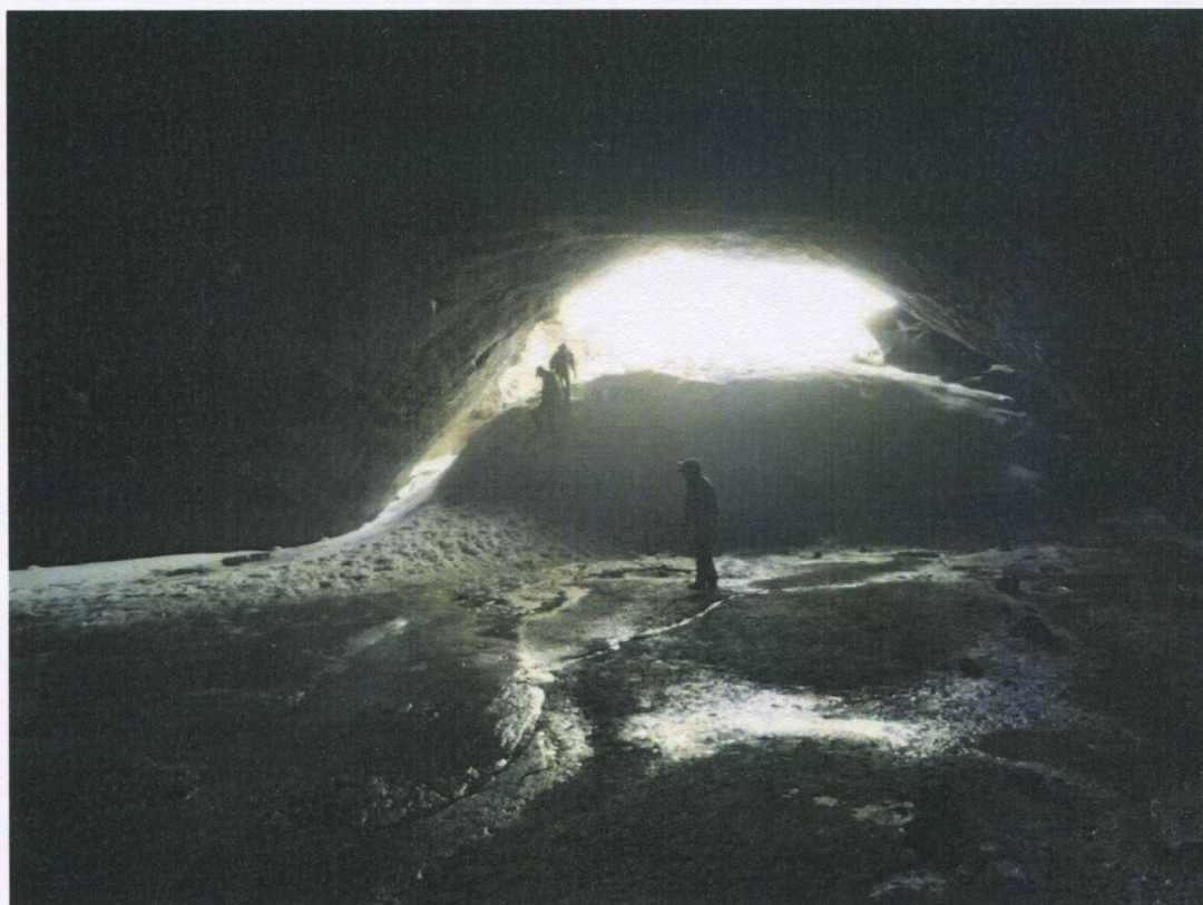
Рис.1 Большая пещера влк. Горелого

Для бивуака выбрали место рядом с подъемной тропой. Поскольку все подножие вулкана завалено острой лавой, на том месте, которое мы выбрали, убрали камни.