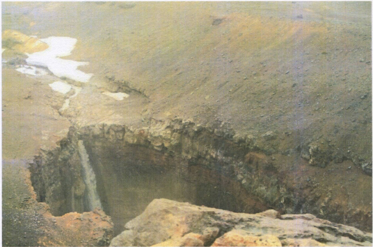
Рис.4 Водопад в каньоне Опасный