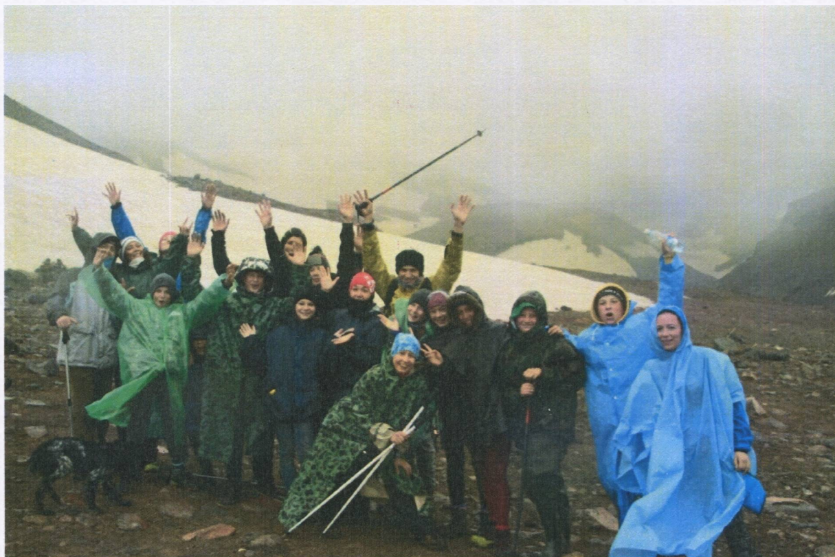
Рис.3 Возле входа в кратер влк. Мутновского

Погода была штормовая, поэтому в кратер входить мы не решились и отправились к каньону Опасный ( Рис.4 ). Очень красивое место, где с высоты около 80 метров р. Вулканная падает в каньон Опасный. Водопад виден сверху, в каньон спуститься нельзя. После того как мы все промокли, мы выдвинулись обратно к Вакинскому домику.