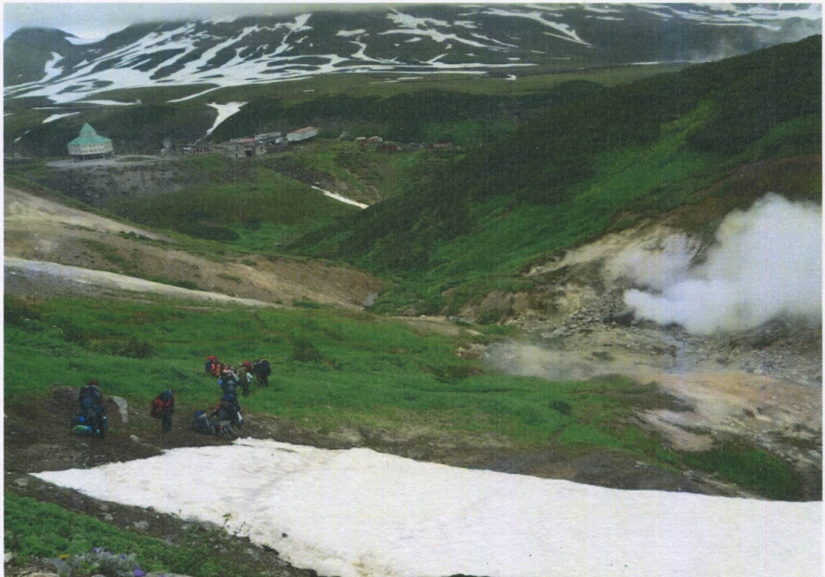
Рис.6 На подходе к Мутновской ГеоЭС