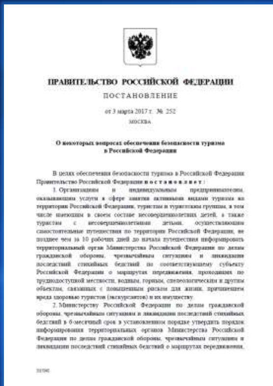
Постановление Правительства Российской Федерации от 03 марта 2017 г. № 252