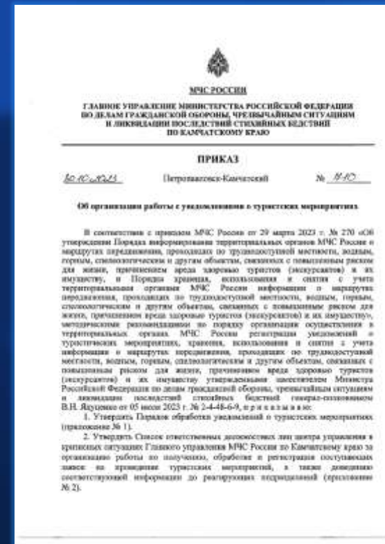
Приказ ГУ МЧС России по Камчатскому краю от 30 октября 2023 г. № 710